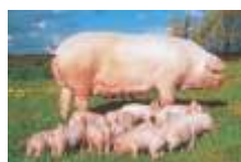
MATRIZ AVÓ REDONE