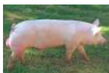
MACHO AVÔ GALLIA